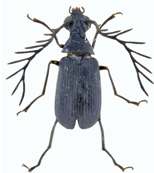
Männchen von Kytorhinus pectinicornis aus der Zoologischen Staatssammlung München.

Die 3–3,5 mm großen Käfer zeichnen sich durch die körperlangen Fühler aus, die beim Männchen stark kammartig und beim Weibchen gesägt ausgebildet sind. Die schwarzen Käfer sind sehr fein grau behaart.