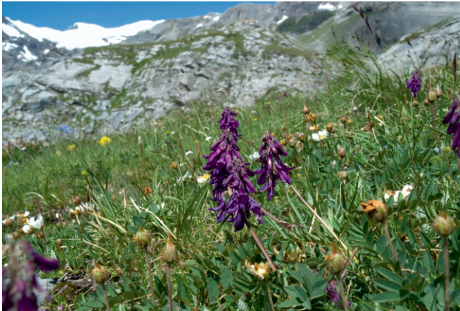
Hedysarum hedysaroides

Die in Alkohol konservierten Tiere waren wie folgt etikettiert: